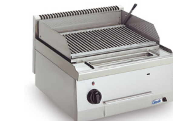
LTC6700 (griglia pesce)*