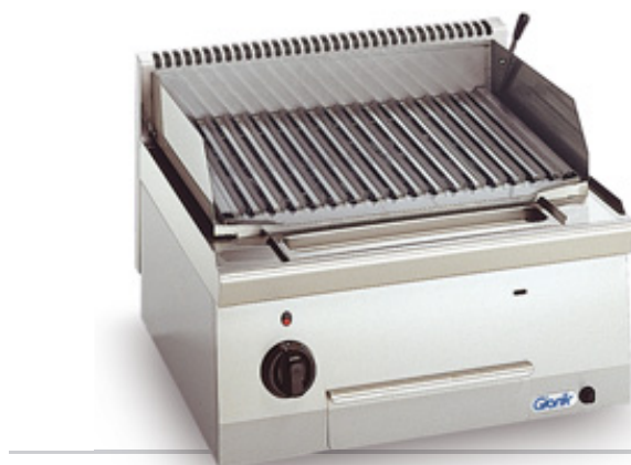
LTC6700 (griglia a golosa)**

Griglie a pietra lavica: un'apparecchiatura top a gas ideale per la cottura di carni, pesci e verdure. Bruciatori tubolari in acciaio inox; accensione piezoelettrica; telaio supporto pietre in acciaio resistente alle alte temperature; griglia a golosa fornita di serie (1); griglia pesce (2) fornita a richiesta. Un sistema a leva (2) permette di variare l'inclinazione e la distanza delle griglie rispetto alla fonte di calore. Bacinelle raccogli sughhi e residui delle pietre (1) facilmente asportabili per la pulizia.